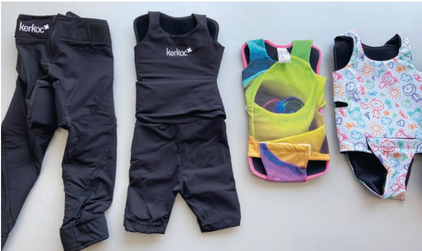
Abb. 3 Elastische textile Kompressionsorthesen stimulieren die Mechanorezeptoren und verbessern durch sensorische Reizapplikation die Haltungs- und Bewegungskontrolle.

baute Kompressionsorthese führt zu einer Verbesserung des Gangbildes im Rahmen der multimodalen Intensiv-Rehabilitation nach Adeli [9].