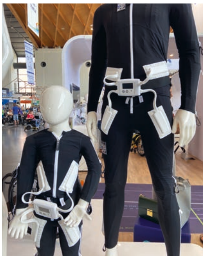
Abb. 7 Neuromodulations-Ganzkörper-Kompressions- und E-Stimulations-Orthesen nutzen das Prinzip der sensorischen Stimulation durch Kompression UND Elektrostimulation mit multipler Wirkung auf die adressierte Muskulatur.

Die sub-sensorische Stimulation, die durch das Adressieren propriozeptiver Afferenzen zur Tonusregulation