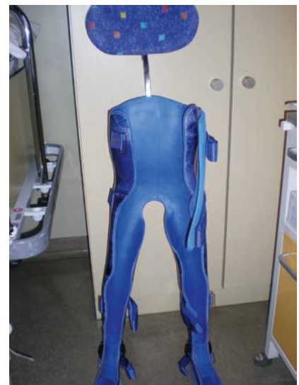
Abb. 6 Dynamische Stehorthesen nutzen das Prinzip der sensorischen Stimulation des Rumpfes und der Beine in Kombination mit minimaler mechanischer Stabilität zur Aktivierung der beckenübergreifenden tonischen Haltemuskulatur.

Für gehfähige Patienten mit zerebraler Bewegungsstörung wurden alternativ zur orthopädischen Schuhversorgung, entsprechend dem Prinzip der „Dynamischen Stabilität“, dynamische, das untere Sprunggelenk stabilisierende kurze Gehorthesen als Knöchel-Fuß-Orthesen (DAFO) mit flexibler ringförmiger Fassung entwickelt. Ihnen liegt der gleiche Wirkmechanismus wie bei der dynamischen Einlage in Kombination mit einer mechanischen Stabilisierung des unteren Sprunggelenkes zugrunde. Indikationen sind instabile, aber noch flexible Spitz-, Platt-, Hohl- und Klumpfüße, bei schweren flexiblen und strukturell fixierten Füßen oder Kontrakturen sind diese jedoch kontraindiziert [22, 23] (Abb. 5). Ebenso signifikant können dynamische Unterschenkel-Gehorthesen (Ankle Foot Orthosis, AFO) bei Patienten mit zerebralen Bewegungsstörungen und einer Instabilität oder (neuro-)muskulären Fehlfunktion des oberen Sprunggelenkes (OSG)/Kniegelenkes ohne schwere strukturelle Fußfehlstellung zur Schmerzreduktion und Verbesserung der Steh- und Gehfunktion durch eine Stabilisierung des unteren