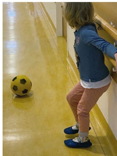
Abb. 5 Dynamische Knöchel-Fuß-Orthesen nutzen das Prinzip der sensorischen Stimulation der Fußsohle und Fußmuskulatur in Kombination mit mechanischer Stabilität des unteren Sprunggelenkes zur Kräftigung der Beinmuskulatur.

dienlage bestätigt eine Evidenz für die qualitative Verbesserung der Steh- und Gehfunktion und Muskeltonus-Regulation durch eine Aktivierung einzelner Muskeln durch propriozeptiv wirksame Reize an der Fußsohle. Signifikante quantitative Veränderungen gegenüber eines Kontrollkollektivs konnten in 3D-Ganganalyse-Studien bisher nicht gefunden werden. Voraussetzung ist eine ausreichende Funktion der Afferenzen ohne schwere strukturelle Fehlstellung. Indiziert sind dynamische Einlagen bei flexib-