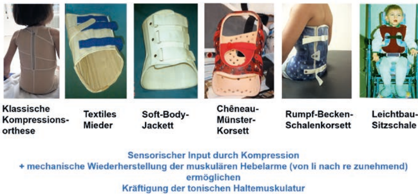
Abb. 4 Dynamische Rumpforthesen nutzen das Prinzip der sensorischen Stimulation durch Kompression und Wärme in Kombination mit individuell notwendiger mechanischer Stabilität zur Kräftigung der Rumpfmuskulatur.

freigegebene Gelenke können tonische wie phasische Muskeln durch die Sicherung physiologischer Ursprungs- und Ansatzpunkte sowie Hebelarme trotz zentraler Paresen maximal aktiviert und gekräftigt werden.